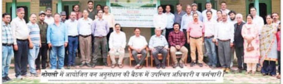
नोगली में आयोजित वन अनुसंधान की बैठक में उपस्थित अधिकारी व कर्मचारी।

इस चुनौतीपूर्ण कार्य को शुरू करने के लिए सतलुज बेसिन के मुख्य हितधारकों वन विभाग, ग्रामीण, शहरी विकास विभाग, बागवानी विभाग, मत्स्य विभाग, कृषि विभाग, पशुपालन विभाग,