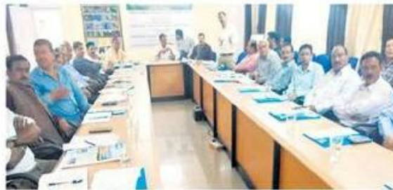
वन अनुसंधान की बैठक में उपस्थित अधिकारी व कर्मचारी।