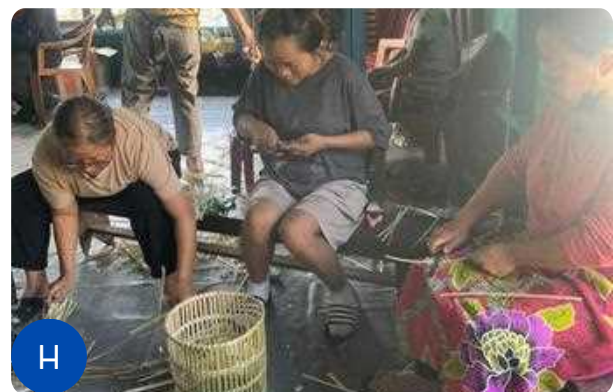
Figure 1: A-H: Glimpses of the hands-on training session