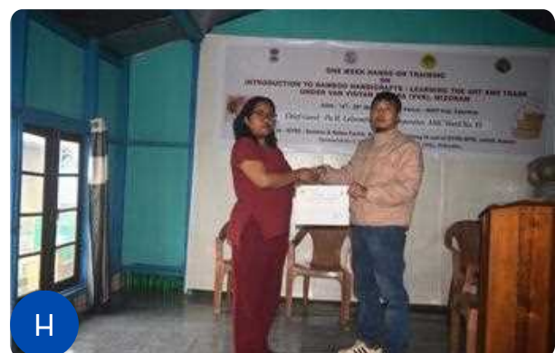
Figure 1: C-H: Glimpses of the valedictory session