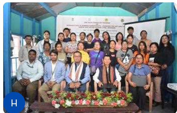
Figure 1: A-H: Glimpses of the Inaugural Session