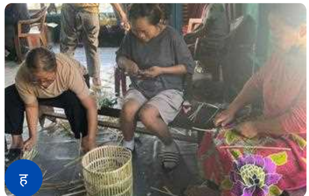
चित्र १: अ-ह: व्यावहारिक प्रशिक्षण सत्र की झलकियाँ