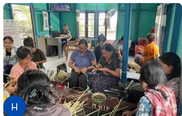
Figure 1: A-H: Glimpses of the hands-on training session