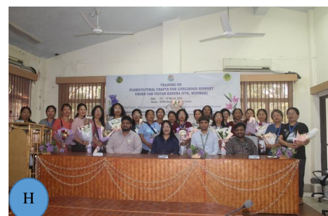
Figure 3: A-H: Distribution of Certificates