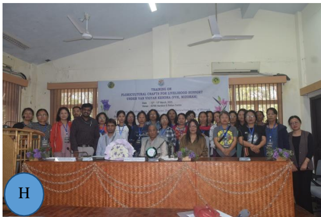
1: A- B: Welcoming & Felicitating of the Guests; C & D: Address by the Director; E: Introduction by the participants; F: Address by the Chief Guest; G: Vote of thanks; H: Group photo