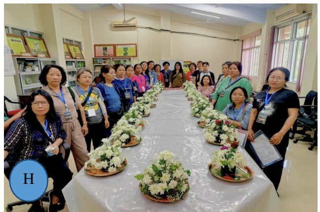
Figure 2: A-H: Glimpses of the training.