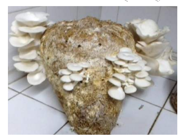
गेहुँ के भूसे पर मशरूम का उत्पादन

धान के पुआल/गेहूं के भूसे का ढांचो मे कवक जाल फैलने के बाद 15 से 20 दिन के पश्चात मशरुम निकलना प्रारम्भ हो जाता है। जब मशरूम के फलनकाय 6 से 8 से.मी. माप के हो जाते है, तब