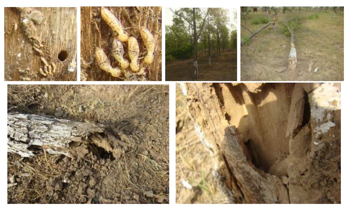
Photographs: Heavy termite attack on trees (SSO) of D.sissoo