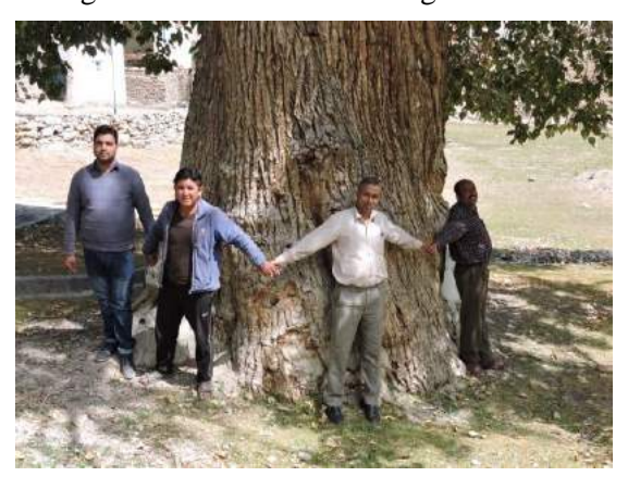
since more than five generations. It is \leq 150 feet in height and its girth is 6.70 meters.

This giant tree has been standing tall and alone