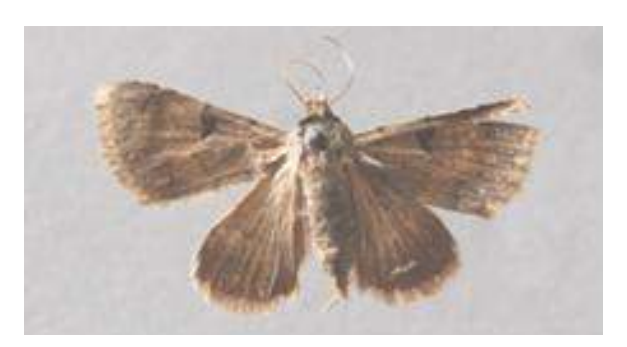
Plecoptera reflexa Data on insect infestation and resistance to insect pests by all selected clones was recorded from damage on leaves of annual twig growth by various insect pests in

plant exhibit symptoms of dieback, leading