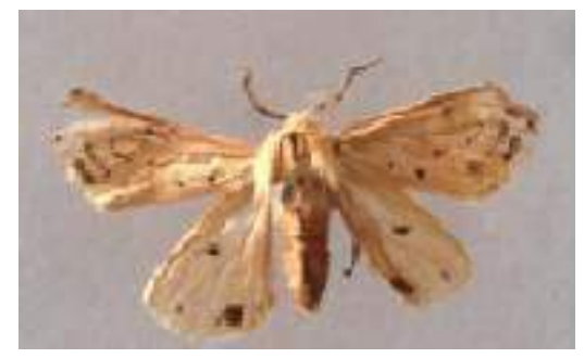
Diacrisia oblique nursery, VMG,CSO and SSO. The data, thus collected was analyzed statistically to identify most resistive Shisham clones.