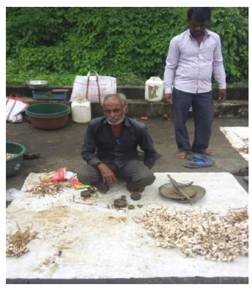
सदर बाज़ार, जबलपुर में मशरूम विक्रय

रिलायन्स स्टोर, जबलपुर में मशरूम विक्रय पैकेट बनाये जाते है जो बाजार में रूपये 40 से 60 प्रति पैकेट के भाव से बिकते है। सूखी ढींगरी या आयस्टर मशरूम के प्रति कि.ग्रा. के पैकेट रूपये 1500 से 2000 के भाव से बिकते हैं।