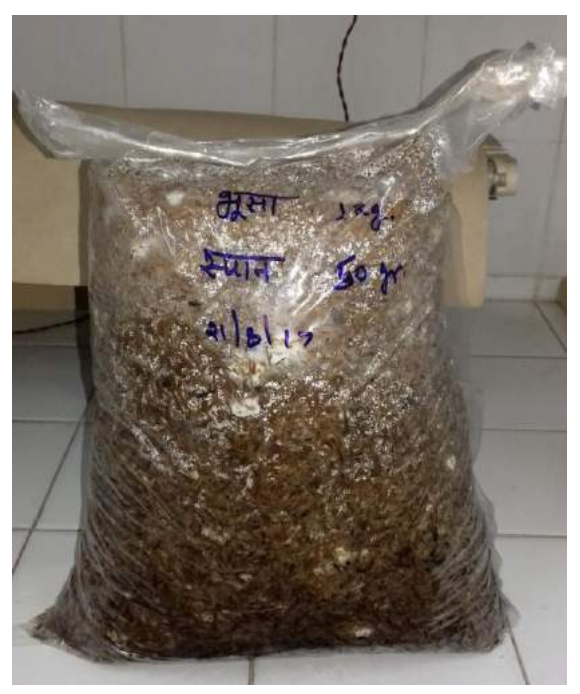
गेहूँ के भूसे पर मशरूम का उत्पादन

बारीक छिद्र वाले फुव्वारे से दिन में 2 या 3 बार कमरे की दिवारो और पुआाल/भूसे के ढांचो पर पानी का छिड़काव करते है, जिससे अवश्यक आर्द्रता बनी रहे।