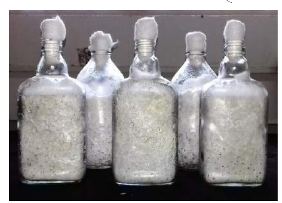
मशरूम का स्पान (बीज)

स्पान (बीज) को गीले पुआल या गेहूं के भूसे में 2 प्रतिशत भार के अधार पर मिलाते हैं अथवा