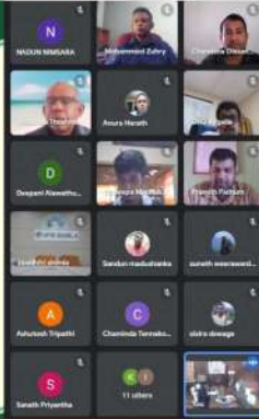
व.अ.सं., देहरादून ने उच्च-तकनीक वन पौधशाला पर वर्चुअल प्रशिक्षण आयोजित किया