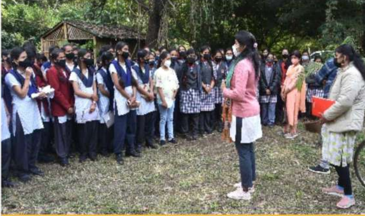
उ.व.अ.सं., जबलपुर में प्रदर्शन कार्यक्रम

वनस्पति उद्यान, ऑर्किडेरियम, कृमिखाद आदि का 20 जनवरी 2022 को प्रदर्शन किया गया। कार्यक्रम में आईआईएफएम, भोपाल के स्नातकोत्तर डिप्लोमा के विद्यार्थियों ने भाग लिया।