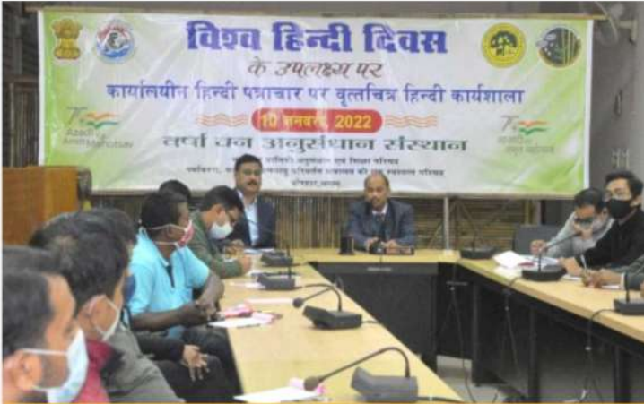
व.व.अ.सं., जोरहाट ने विश्व हिंदी दिवस मनाया

व.व.अ.सं., जोरहाट और व.उ.सं., रांची ने 10 जनवरी 2022 को विश्व हिंदी दिवस मनाया।