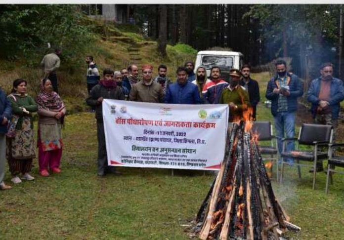
हि.व.अ.सं., शिमला ने बांस पौधारोपण एवं जागरूकता कार्यक्रम का आयोजन किया