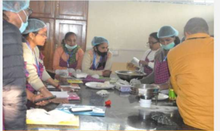
व.व.अ.सं., जोरहाट में बांस प्ररोह प्रसंस्करण और मूल्यवर्धन पर प्रशिक्षण