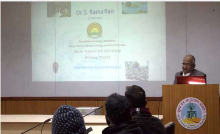
शु.व.अ.सं., जोधपुर में वन वृक्षों की कृतकीय तदरूपता के आकलन – एक आणविक साइटोजेनेटिक्स उपागम पर सेमिनार