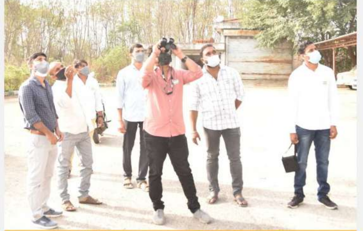
व.जै.सं., हैदराबाद ने बर्ड वाचिंग कार्यक्रम आयोजित किया