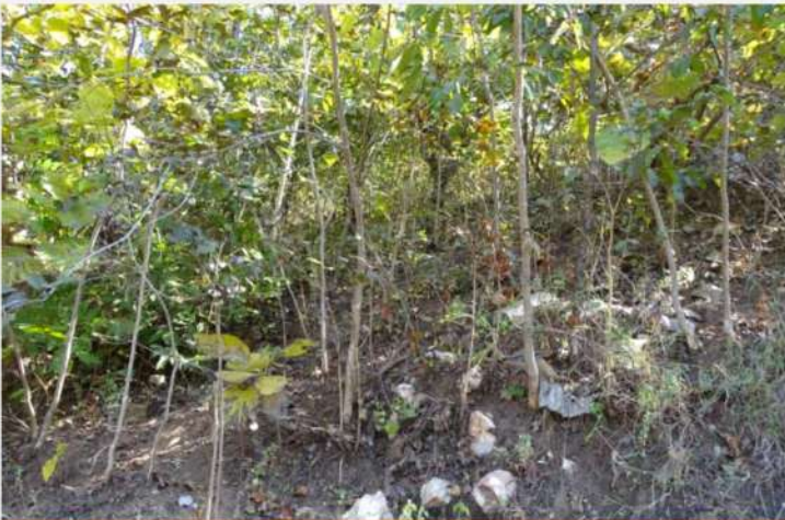
एनोजिसस लैटिफोलिया का पुनर्जनन