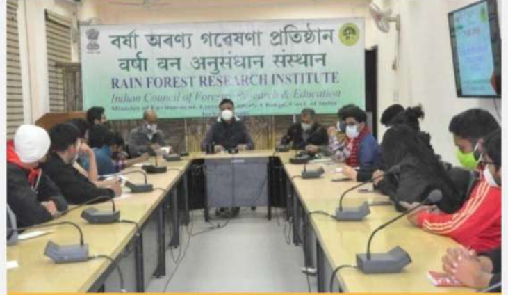
व.व.अ.सं., जोरहाट में प्रदर्शन कार्यक्रम

वनस्पति उद्यान, ऑर्किडेरियम, कृमिखाद आदि का 20 जनवरी 2022 को प्रदर्शन किया गया। कार्यक्रम में आईआईएफएम, भोपाल के स्नातकोत्तर डिप्लोमा के विद्यार्थियों ने भाग लिया।