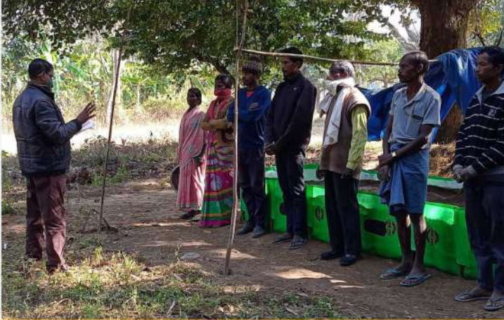
व.उ.सं., रांची ने कृमि युक्त कृमिखाद बेड का वितरण एवं स्थापना की