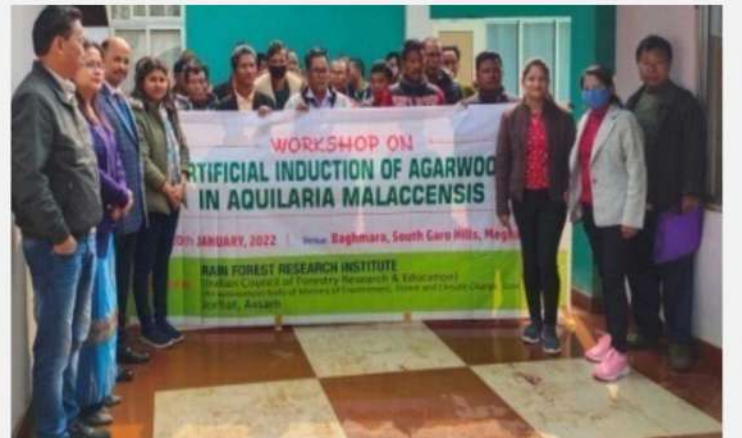
व.व.अ.सं., जोरहाट में एक्विलेरिया मैलाकेंसिस में अगरकाष्ठ पर कृत्रिम संरोपण पर कार्यशाला